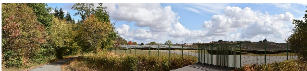
Photomontage 1 – Vue depuis la voie existante à l'Ouest du projet en direction de l'Est

... 80 000€/an de retombées fiscales et locatives sur l'ensemble des collectivités.